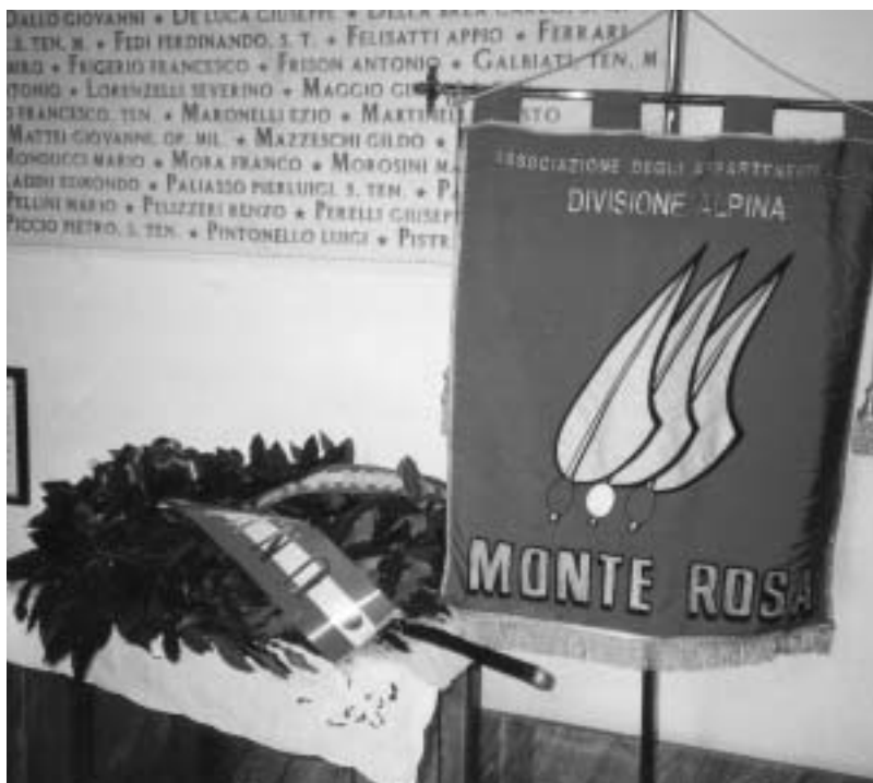
La corona offerta dal Presidente della sezione U.N.U.C.I. di Mirandola (MO) presente al nostro incontro del 28 marzo 2004.