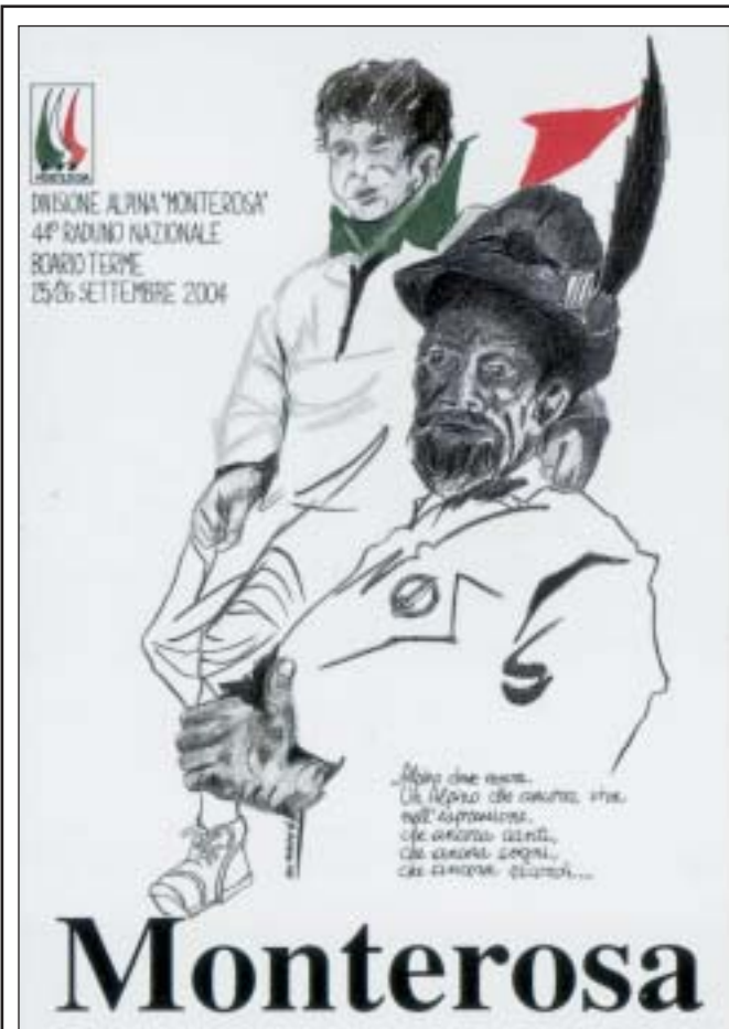
Grafica e stampa a cura di Pino Baron