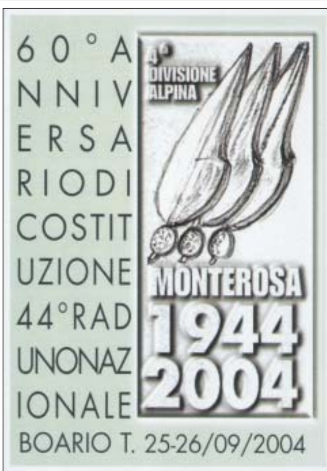
Grafica e stampa a cura di Gianugo Taggiasco