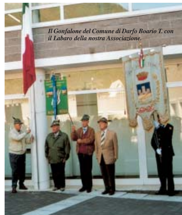
Il Gonfalone del Comune di Darfo Boario T. con il Labaro della nostra Associazione.